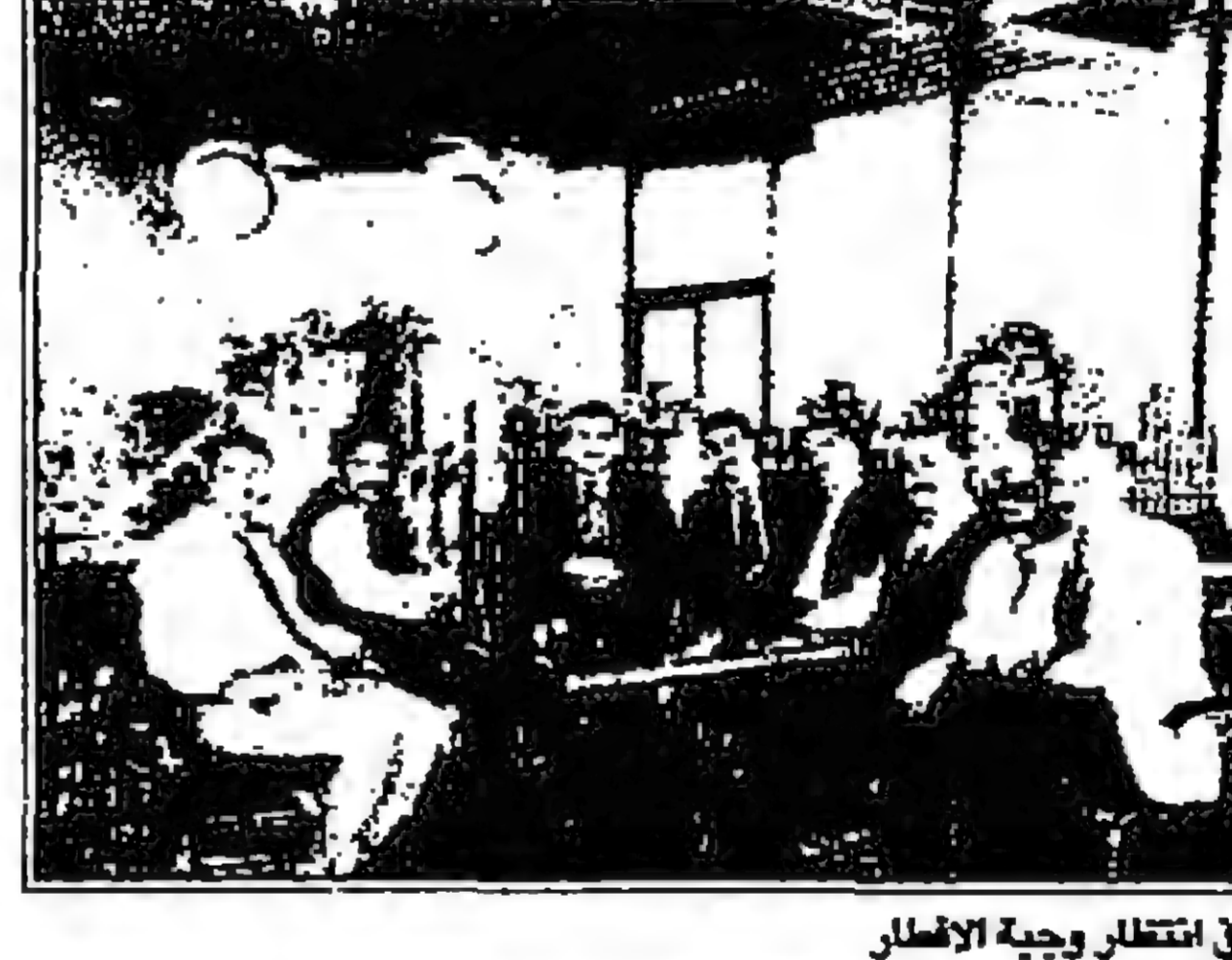
في انتظار وجبة الإفطار